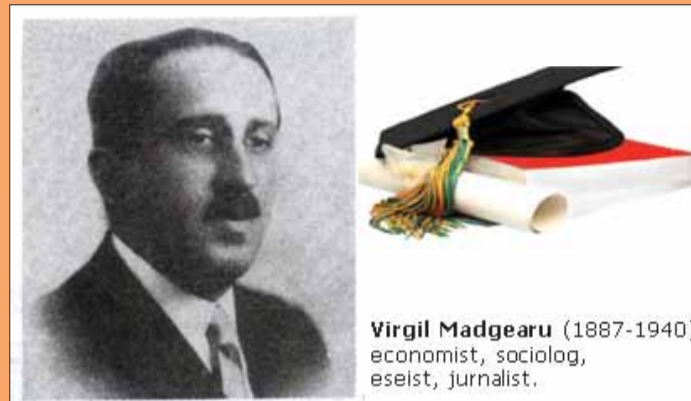
Virgil Madgearu (1887-1940), economist, sociolog, eseist, jurnalist.

Notă: Liceul Tehnologic „Virgil Madgearu” este o unitate de învățământ particulară, acreditată conform O.M. 4818/2011 .